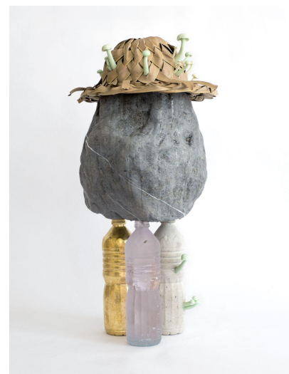
Spiritus Mundi, 2021, Technique mixte, 120 x 60 x 60 cm

Algues bioluminescentes, scarabées irisés, réfractions lumineuses, pierres mouvantes, le travail de Jonathan Bréchignac prend comme point de départ ces phénomènes naturels qui malgré les explications scientifiques gardent un pouvoir de fascination intact. Sa pratique interdisciplinaire mêle sculpture, installation et peinture. L'exploration de la matière occupe une place importante dans sa pratique artistique qui emprunte des codes liés au monde scientifique (collecte d'échantillons, expériences et matériel de laboratoire...). En recréant du « vivant » à partir de matériaux synthétiques mis en scène à l'aide de nouvelles technologies, Jonathan Bréchignac crée une poétique de la fascination : il questionne la frontière entre naturel et artificiel ainsi que le rapport de notre époque au vivant. Dans son travail, l'invocation de mythes populaires, de théories scientifiques et ésotériques trouble la perception, entre fiction et réel. Il pointe les limites de notre capacité à comprendre le monde, dévoilant ainsi les processus par lesquels la croyance émerge. Jonathan Bréchignac est lauréat du prix Art of Change 21 parrainé par Ruinar.