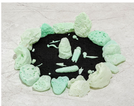
Petit feu, 2019, Résine, pigments, sable noir, 20 x 70 x 70 cm