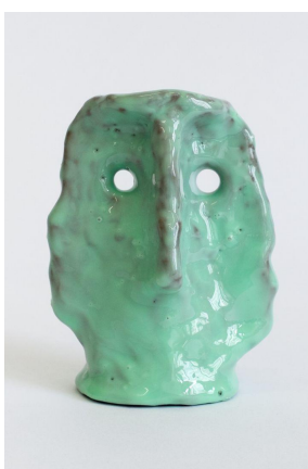
Statuette 5, 2020, Argile crue, résines, pigments, 12 x 9 x 8 cm