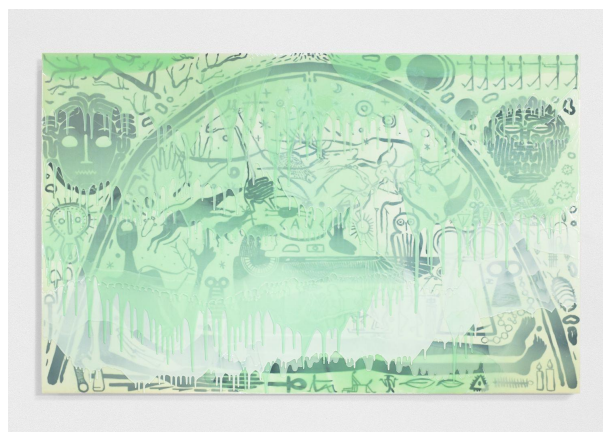
Fresque, 2020, résine, pigments, acrylique sur panneau de bois, cadre aluminium, 120 x 180 cm